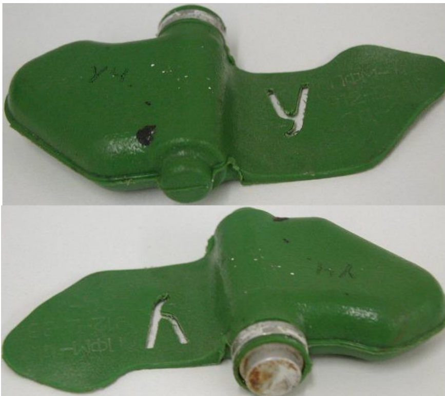
Размеры «Мины – ЛЕПЕСТКА»: