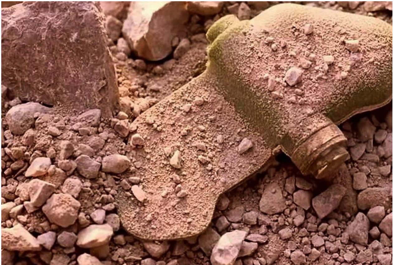
«Мина – ЛЕПЕСТОК» в боевом положении на тропе: